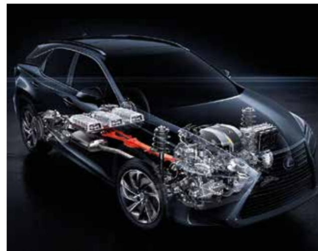
Toyota und Lexus Hybride erreichen schon jetzt EU-Grenzwerte für das Jahr 2020 (95 g CO 2 /km)

Aus heutiger Sicht ist es unsicher, wie sich die Dieselpolitik und der Klimaschutz entwickeln werden. Die Hybrid- und Benzin-Autos von Toyota & Lexus erreichen jedoch bereits jetzt schon die von der EU festgesetzten Grenzwerte des CO 2 -Ausstoßes von PKW für 2020 (95g CO 2 /km).